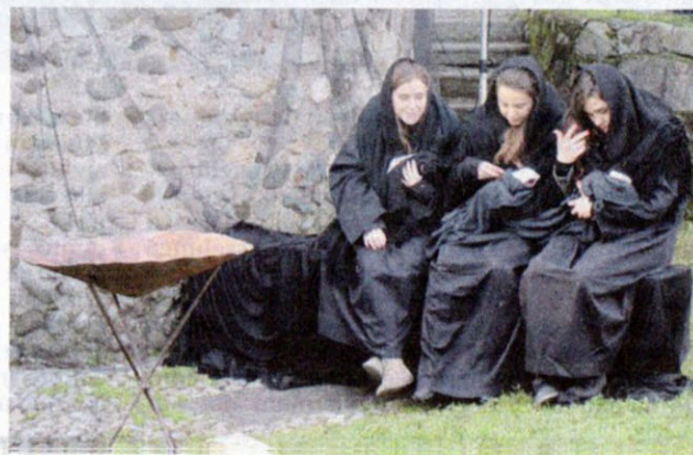
Alcune foto della bella rappresentazione del Presepe vivente di Agliate andato in scena ieri pomeriggio, lunedì. Tantissimi i visitatori accorsi nel parco della basilica di Agliate