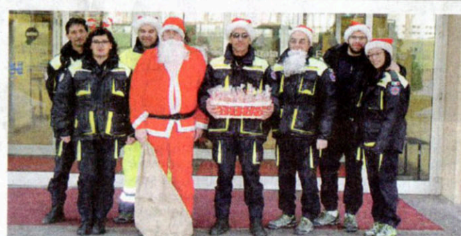
I volontari della Protezione civile in ospedale. Un'altra bella tradizione quella delle tute gialle caratesi che la mattina del 25 dicembre hanno accompagnato Babbo Natale in visita ai reparti