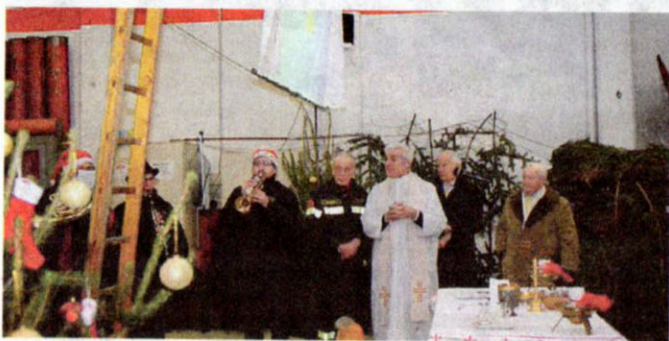
Messa di mezzanotte al distaccamento dei Vigili del fuoco. Come da tradizione pompieri, famigliari e tanti amici hanno partecipato alla celebrazione natalizia prima dello scambio degli auguri